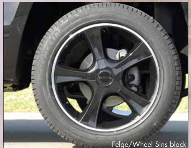
Felge/Wheel Sins black