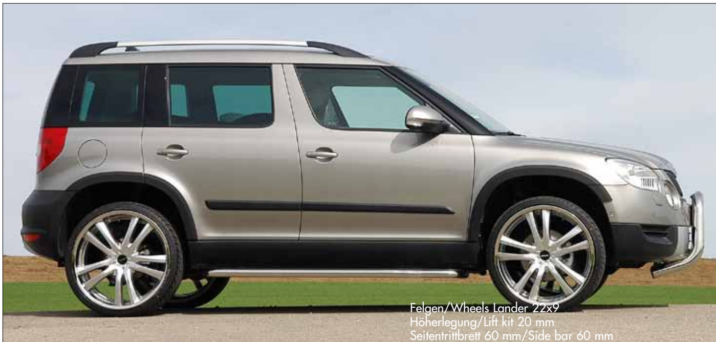
Felgen/Wheels Lander 22x9 Höherlegung/Lift kit 20 mm Seitentrtrittbrett 60 mm/Side bar 60 mm