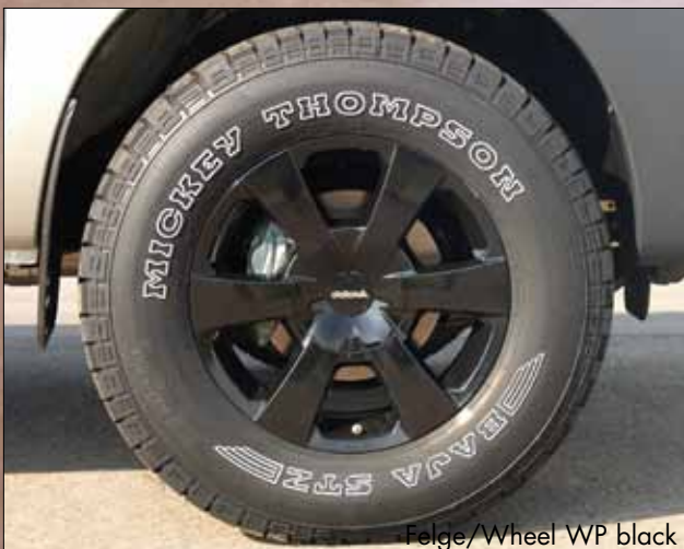
Felge/Wheel WP black