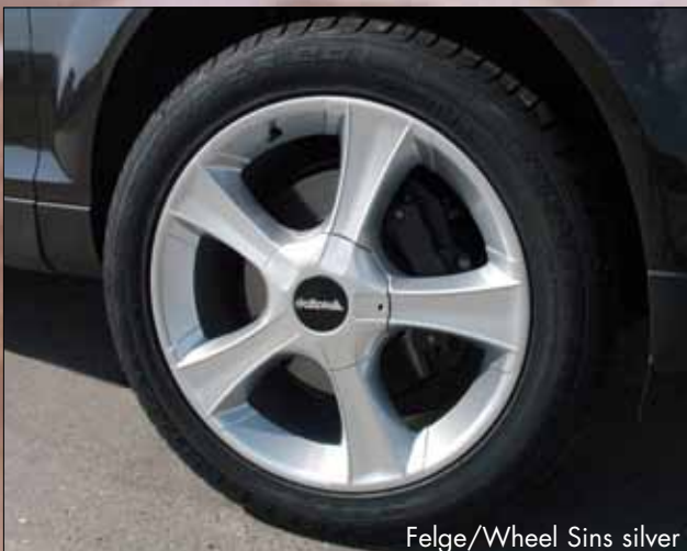
Felge/Wheel Sins silver