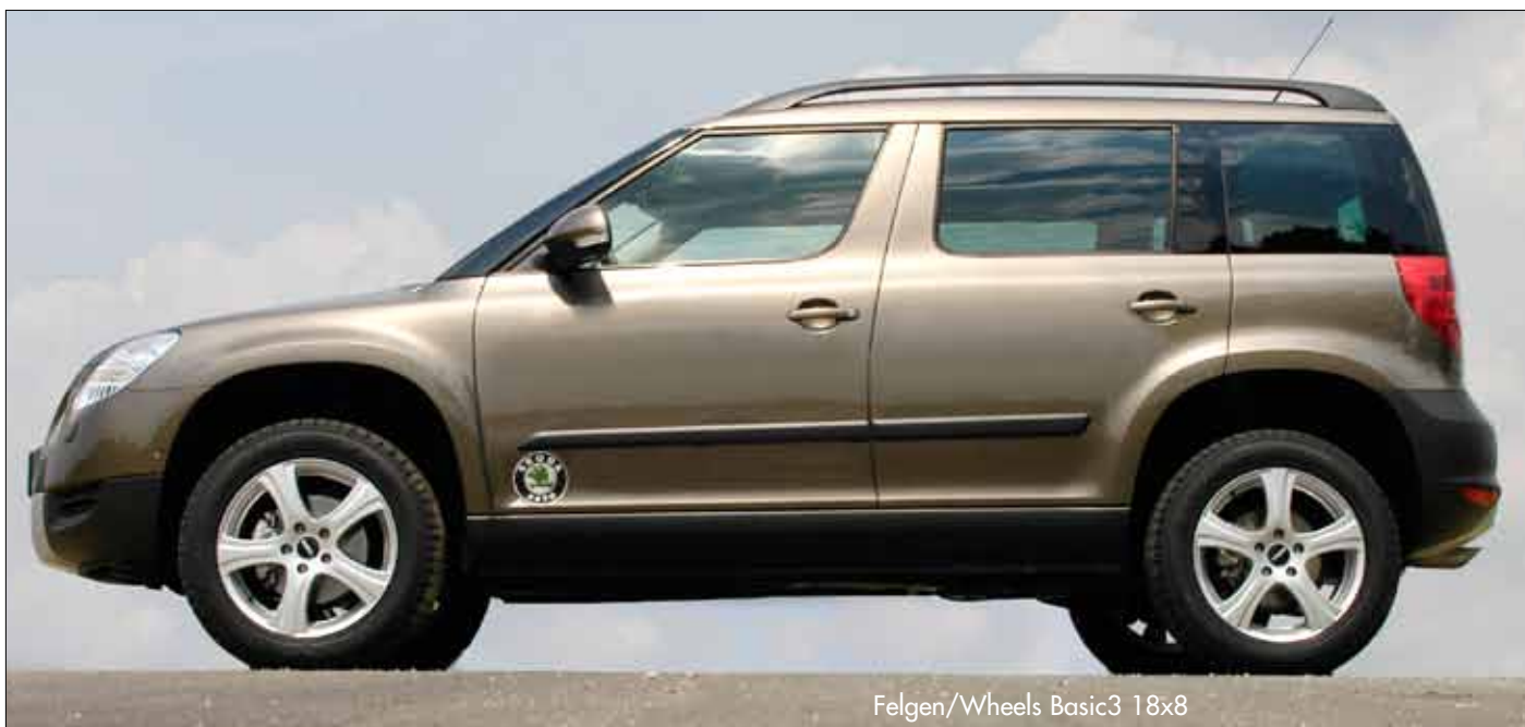
Felgen/Wheels Basic3 18x8