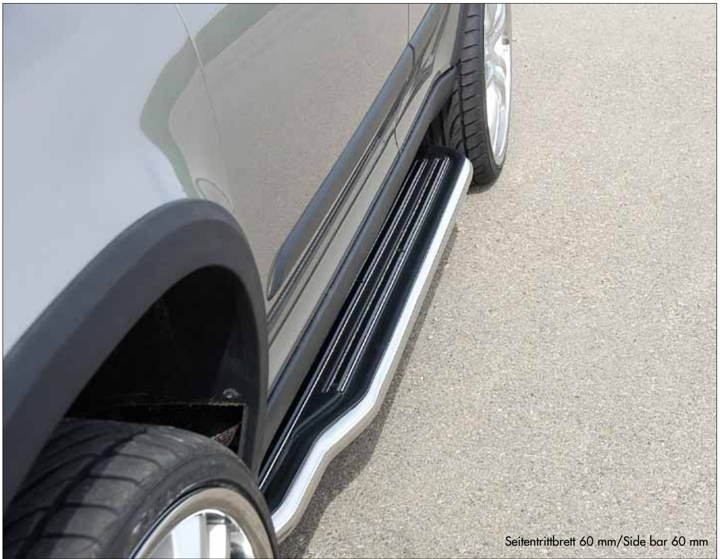
Seitentrittbrett 60 mm/Side bar 60 mm