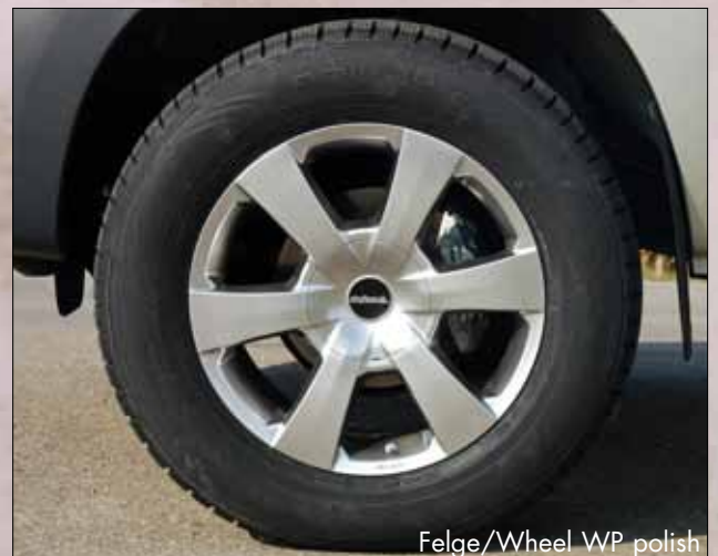
Felge/Wheel WP polish