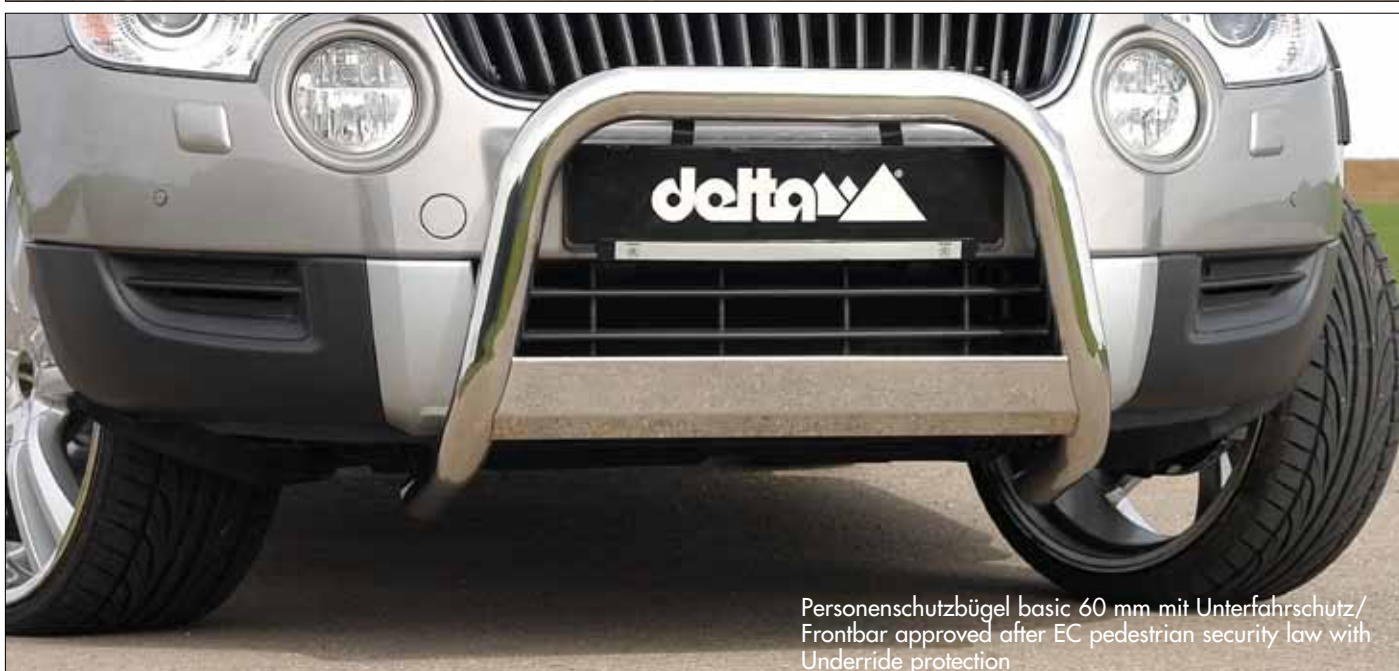
Personenschutzbügel basic 60 mm mit Unterfahrerschutz/ Frontbar approved after EC pedestrian security law with Underride protection